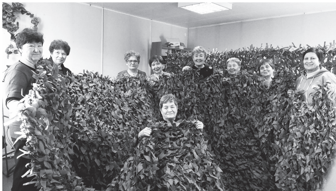
Именно эта сеть дошла до адресата. Наши земляки, участники СВО, передали благодарность «серебряным волонтерам» из с. Турунтаево.

Герои публикации - замечательные женщины, которые достигли пенсионного возраста, имеющие богатый жизненный и трудовой опыт.