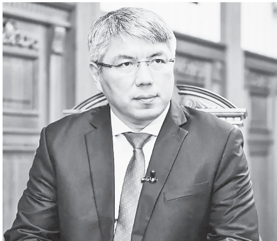
ПРЕСС-СЛУЖБА ПРАВИТЕЛЬСТВА РБ.

— Уже 15 марта начнется голосование на выборах президента России. Каждый из нас получил исторический шанс определить дальнейший путь нашей страны. Именно мы, граждане Российской Федерации, несем ответственность за то, какой будет наша Родина. Отказаться от голосования — значит помочь врагам, которые не оставляют попыток развалить нашу страну.