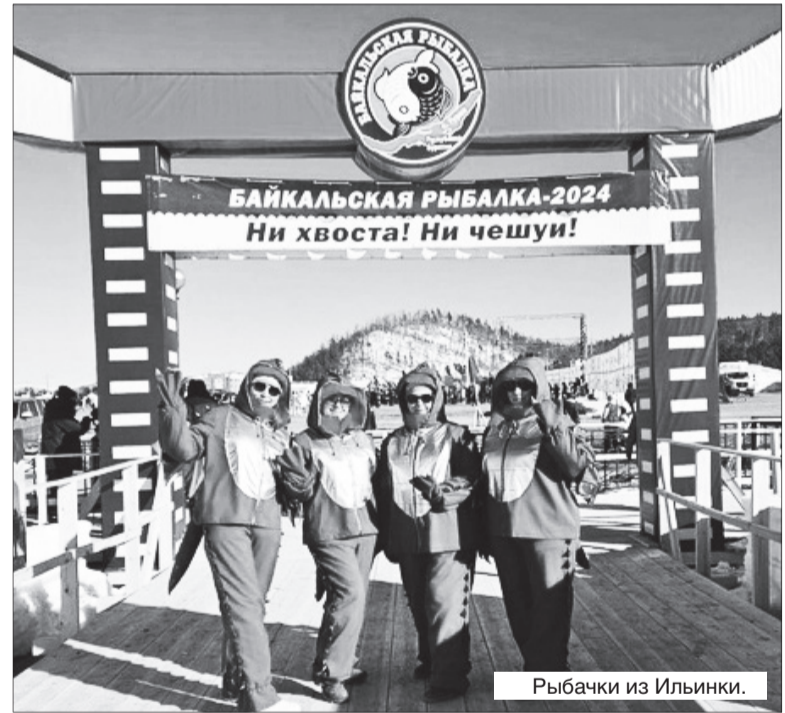
Рыбачки из Ильинки.