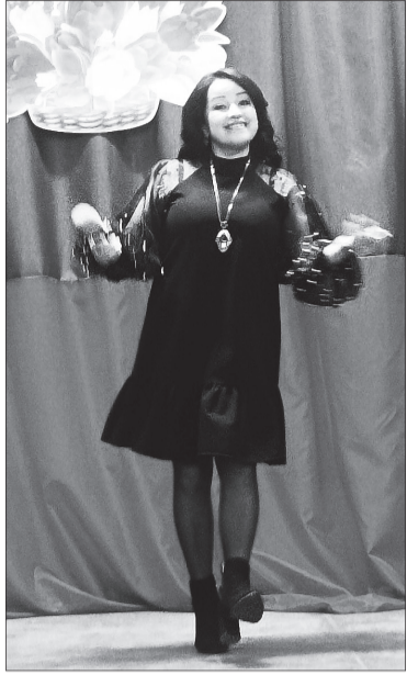
К воинам, проходящим лечение в госпитале, прибыли вокальные группы "Мелодия", с. Турунтаево, «Крецендо», ст. Таловка, вокаль-