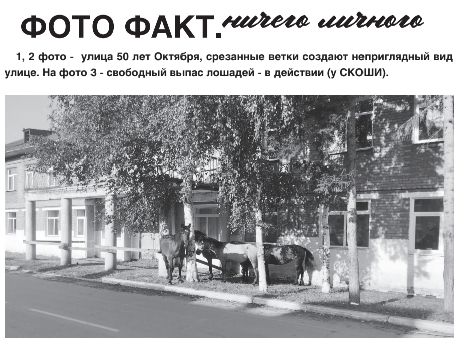
ФОТО ФАКТ. ничего лишнего

1, 2 фото - улица 50 лет Октября, срезанные ветки создают неприглядный вид улице. На фото 3 - свободный выпас лошадей - в действии (у СКОШИ).