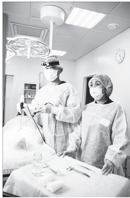
лин, удаление ушной серы, синус-катетеризация ЯМИК и т.д.) и физиотерапии.

В ЛОР-центре помимо хирургической помощи оказывается также и амбулаторная. В консультативном кабинете проходит прием врача-оториноларинголога. Осмотр пациентов производится с помощью современного видеоконтролируемого оборудования. Также возможно проведение различных ЛОР-манипуляций (промывание лакун минда-