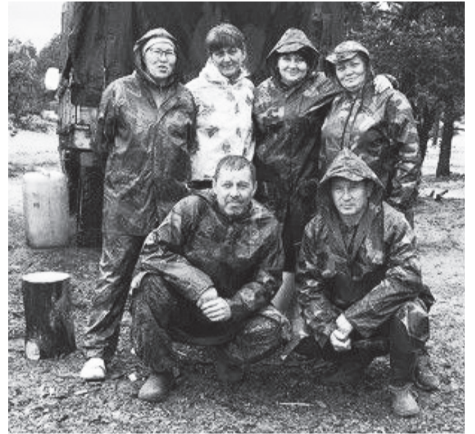
11 класс «бэшки»

Ко Дню учителя хочется рассказать о наших учителях ТСОШ №1, которые на протяжении многих лет, бросая всё, устраивают нам замечательный отдых на берегу озера Байкал.