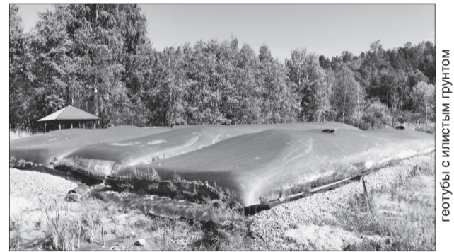
геотубы с илистым грунтом

По состоянию на 09.10.2024 объем изъятых донных от-