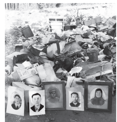
Портретная галерея на свалке около п. Лиственничный.