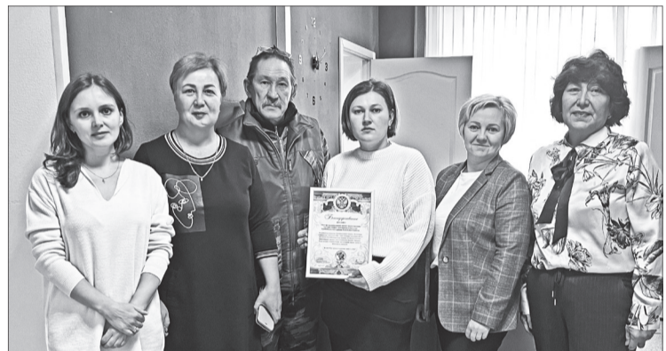
Коллектив МФЦ и Налоговой службы.