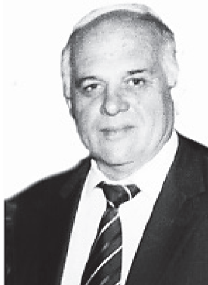
Коренной прибайкалец, он родился 15 сентября 1954 года в с. Таланки, находив-

Коллективы Кикинского лесхоза и Кикинского лесничества приносят соболезнования родным и близким.